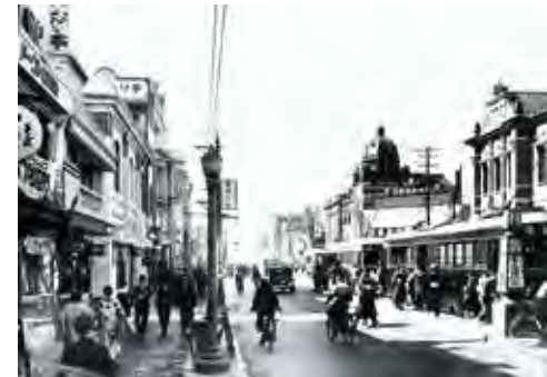
13. 市電市電栄町停車場(1939年頃)

昭和9年(1934)名古屋市人口は100万人を突破した。それにあわせて名古屋市内の詳細な住宅地図が刊行された。