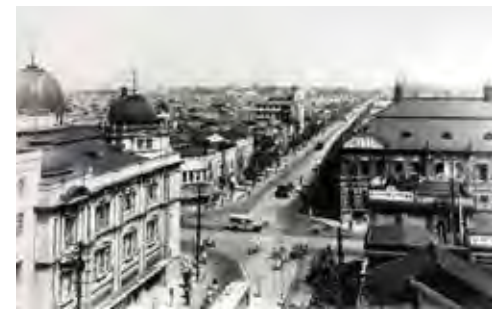
12. 栄町交差点(1936年頃)鶴舞中央図書館蔵