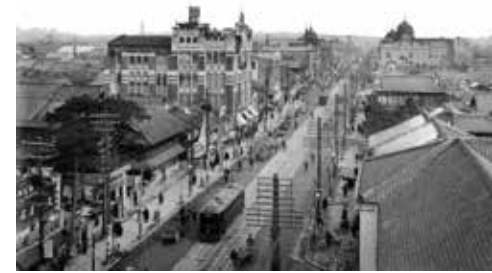
11. 十一屋百貨店付近の広小路(1926年頃)鶴舞中央図書館蔵