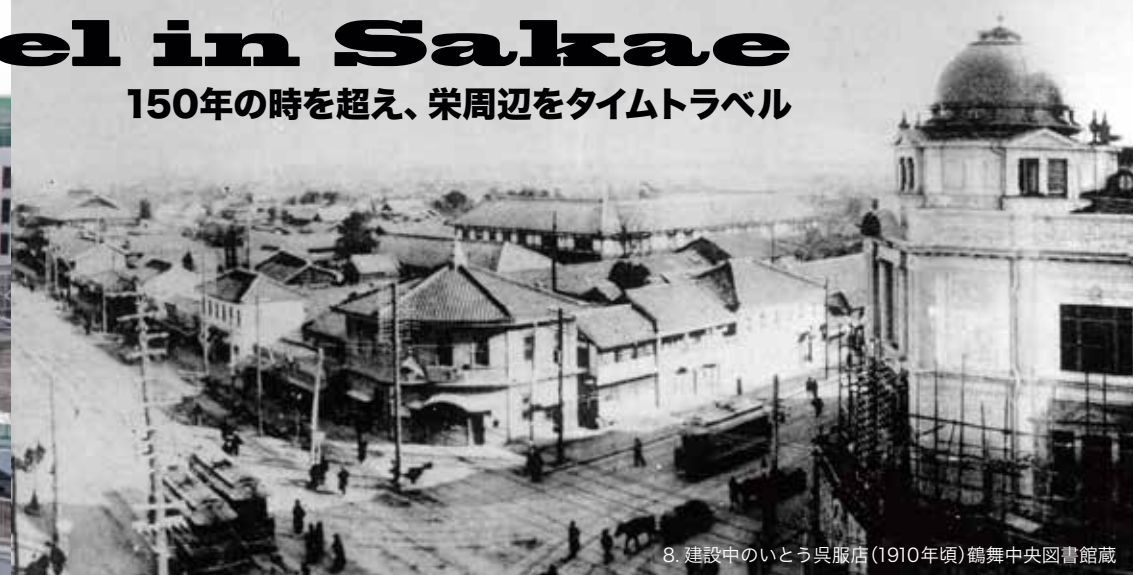
8. 建設中のいとう呉服店(1910年頃) 鶴舞中央図書館蔵