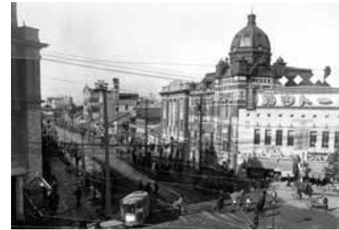
10. 栄町交差点(1926年頃)